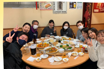
去年の親睦会の様子(豊味苑)